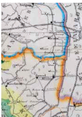
1849 / B = 1,01

kaarten moeten derhalve op zeer grote dimensien geteekend zijn, en toch slechts het allervoornaamste bevatten.' De overlading was waarschijnlijk een gevolg van het feit dat al eeuwenlang geen duidelijk onderscheid werd gemaakt tussen wandkaarten en handkaarten. Pas aan het eind van de negentiende eeuw kwamen er duidelijke eisen waaraan effectieve schoolwandkaarten