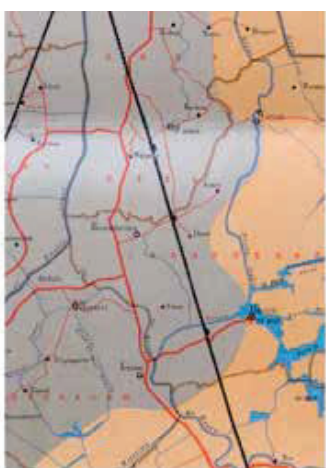
1883 / B = 0,82