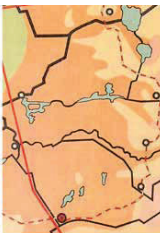
1906 / B = 0,36

De numerieke kaartbelasting B van drie fragmenten (elk ca. 600 cm 2 ) van schoolwandkaarten van Friesland uit 1849, 1883 en 1906. B (in punten/cm 2 ) is bepaald door telling van punt- en lijnsymbolen en geografisch namen, en vertoont een dalende trend. In: Geo-Info 8 (2011), nr. 7/8, p. 24-30.