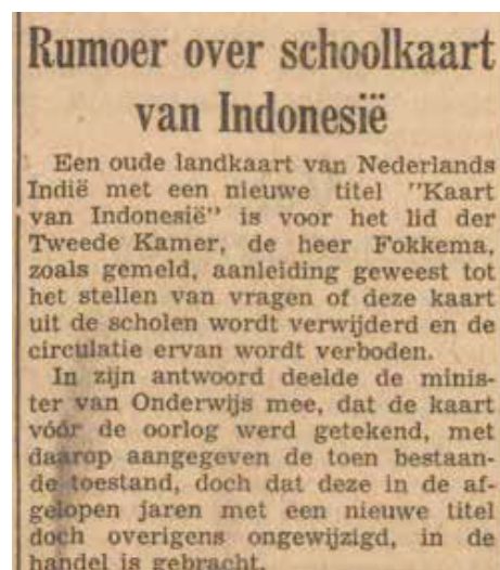
Artikel op de voorpagina van de Emmer Courant van 30 december 1955.

En ook Eibergen kreeg kort daarop eindelijk meer duidelijkheid. Als gevolg van het mislukken van de Geneefse Conferentie (februari 1956) zegde de Indonesische regering direct daarna de Nederlands-Indonesische Unie op. De Nederlandse regering kon niet achter blijven en voegde via een grondwetswijziging in 1956 Nieuw-Guinea toe aan het grondgebied van het Koninkrijk der Nederlanden. De reactie van Eibergen was ook snel te noemen: een schoolwandkaart van Nederlands-Nieuw-Guinea verscheen nog in 1956. 'Een echte klasse-kaart' volgens een recensent en hij hoopte dat er 'nog talrijke sterk gewijzigde herdrukken verschijnen, die bewijzen dat ons "trustschap" land en volk ontgint resp. omhoogvoert.' De herdrukken kwamen er niet. Die voor velen vermaledijde overdracht aan Indonesië vond als nog plaats in 1963, en weer moest een uitgave van een wandkaart van Eibergen worden gestaakt. Het betekende tevens het einde van een lange traditie van schoolwandkaarten van Nederlands Oost-Indië c.q. Indonesië bij uitgeverij Wolters.