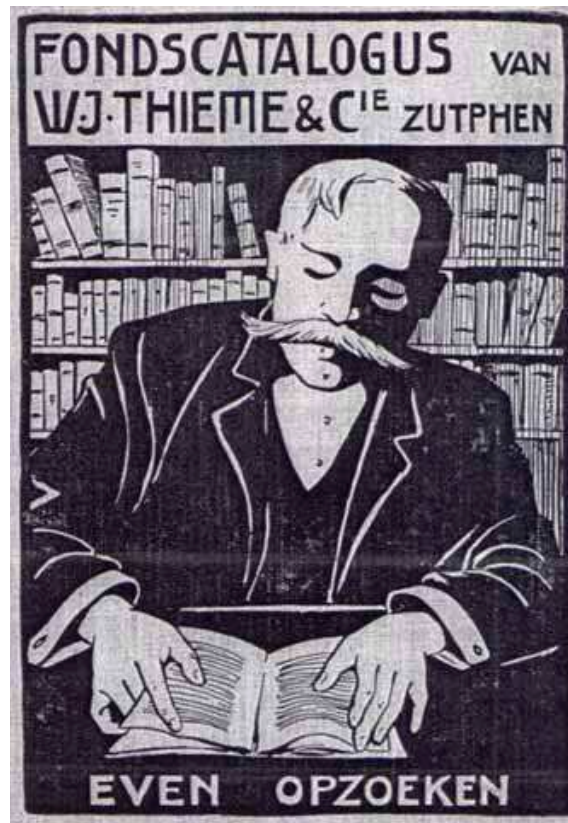
1. Omslagillustratie van de fondscatalogus uit 1908 van uitgeverij Thieme.