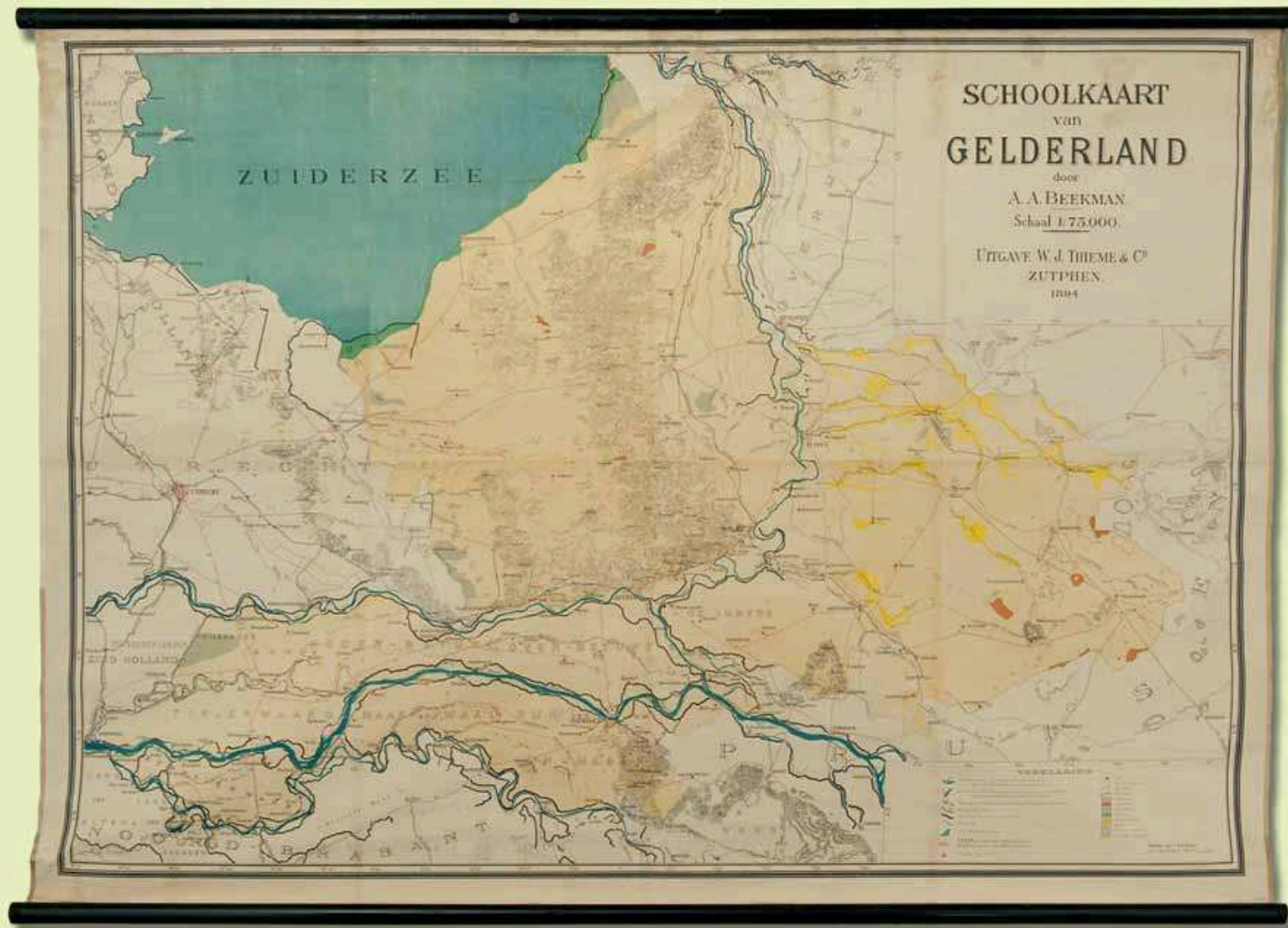
4. Schoolkaart van Gelderland van A.A. Beekman (1894, schaal 1:75.000, acht bladen, 122 x 174 cm). De lichtgroene kleur van het rivierkleigebied is op dit exemplaar verbleekt en moeilijk te onderscheiden van de lichtgele zandkleur.