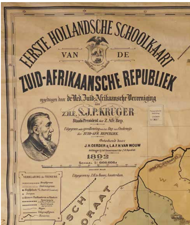
Kaarttitel en opdracht aan president Kruger.

BRONNEN: ZIE WWW.WERELDAANDEWAND.NL/ARTIKEL33.HTM