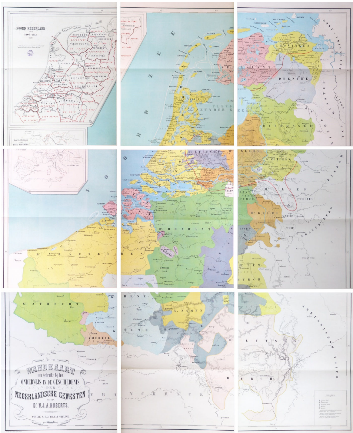
15. 'Wandkaart ten gebruike bij het onderwijs in de geschiedenis der Nederlandsche gewesten' van W.J.A. Huberts (GES_TW1, [1869], kaartblad circa 56 x circa 46 cm). Deze kaart kan worden beschouwd als de eerste Nederlandse geschiedeniswandkaart.