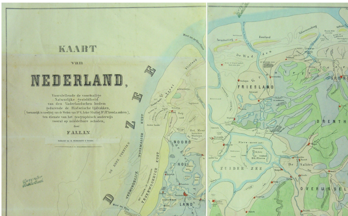
14. Het noordwesten van Nederland; boven: fragment van de 'Kaat van Nederland, voorstellende den bodem en de wateren in hunnen alouden of natuurlijken staat' van G. Acker Stratingh (1847, gehele kaart 52 x 48 cm), onder: fragment van de 'Kaat van Nederland, voorstellende de voormalige natuurlijke gesteldheid van den vaderlandschen bodem gedurende de historische tijdvakken, etc.' van F. Allan (1856, kaartblad 51 x 37 cm). Allans kaart is grotendeels een kopie - op wat grotere schaal en met andere kleuren - van de kaart van Acker Stratingh.